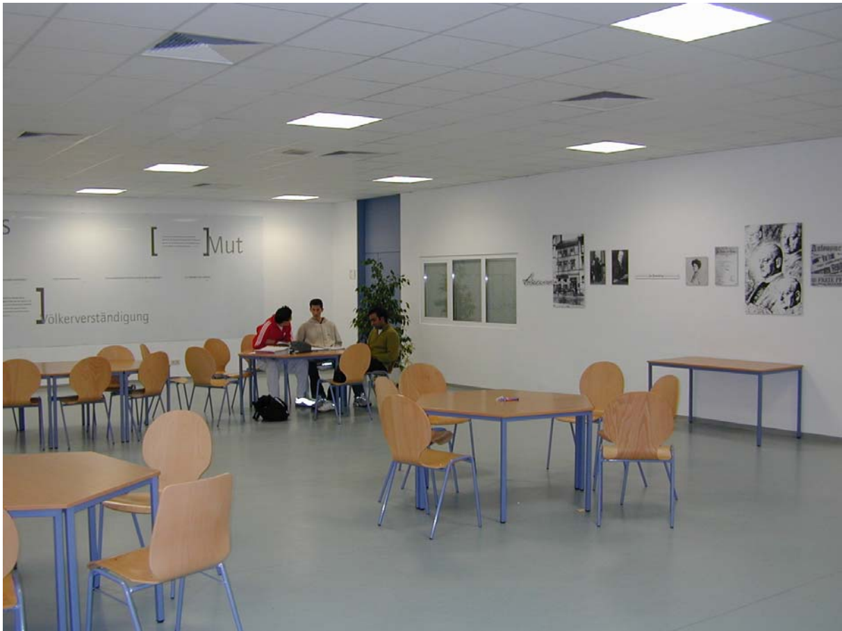
Das Stresemann-Raumobjekt der Gustav-Stresemann-Wirtschaftsschule (2002)